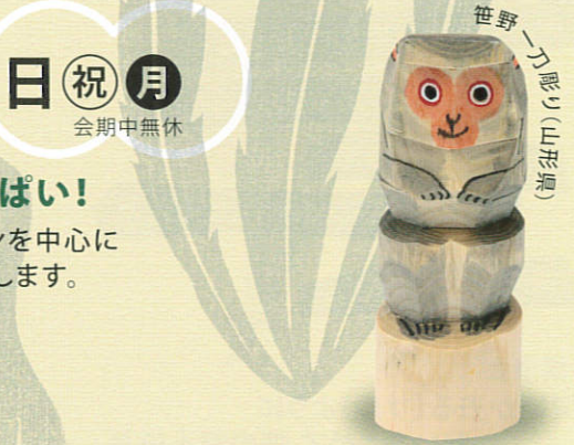
笹野一丁彫り(山形県)