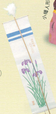
笹田の長(猿)(愛知県)