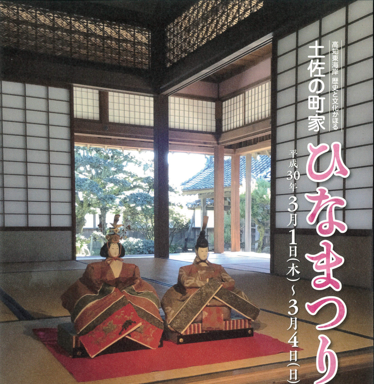
写真: 田野町(高知県指定文化財)岡御殿