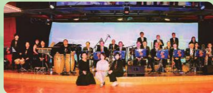
K.B. 高知ビッグバンド