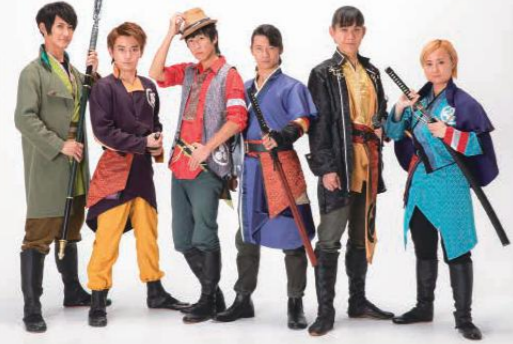
土佐おもてなし海援隊