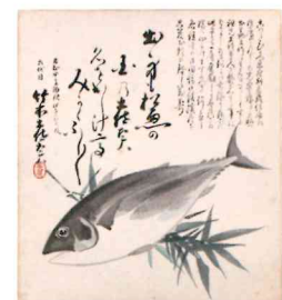
六世 土佐太夫襲名時の色紙 (個人蔵)