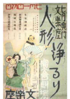
文楽座人形浄瑠璃興行ポスター (個人蔵)