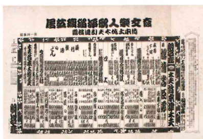
明治座における引退披露公演 番組 (個人蔵)