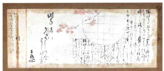
土佐太夫書簡 (個人蔵)