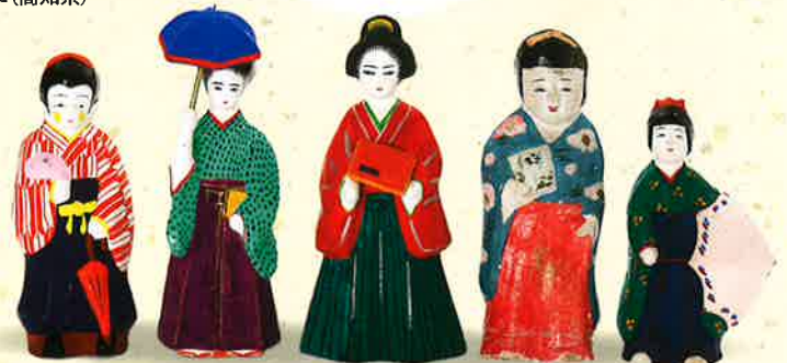
左から 会津中湯川人形(福島県)・長門張り子(山口県)・長門張り子(山口県)・佐土原人形(宮崎県)・古賀人形(長崎県)