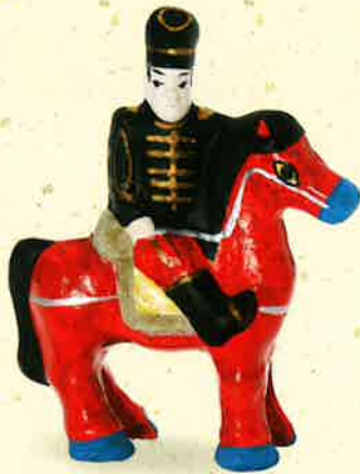
富土山人形(富山県)

明治時代、外国の文化が日本に入ってくると、各地で手作りされてきた多くのおもちゃは廃れていきました。しかし、それまでお守りとして、お土産として、子どもたちの遊び道具として親しまれてきたおもちゃの魅力を、へそ曲がりな大人たちが見出し、鑑賞して楽しむようになりました。そうしたおもちゃは、やがて「郷土玩具」と呼ばれ、今なお愛され、今また静かなブームです。