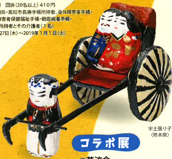
宇土張り子 (熊本県)