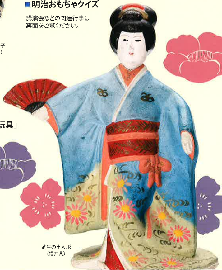
武生の土人形 (福井県)