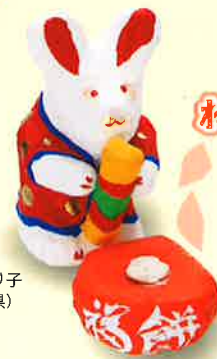
佐原張り子 (千葉県)