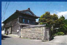
森家住宅(旧野村邸)