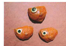
金目鯛マグネット (制作: 澤田亮/協力: 前田捷子)

古民家Artの7つの会場をめぐるスタンプ ラリーです。各会場のスタンプを集めると、 「なはりの郷」にて記念品を1つプレゼント します(先着順)。歴史的な建物が残されて いる奈半利の町並みを歩いてみよう!