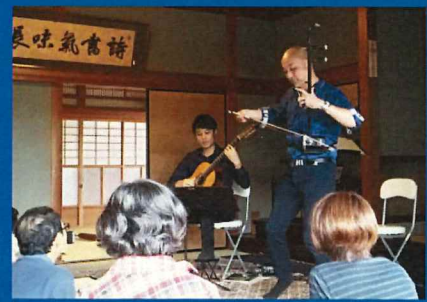
毎年好評を得ている「Gentle」(ex.いちむじん)が今年も奈半利にやってきます。奈半利を代表する古民家・濱田邸にて、ギターと二胡の音色が異空間へと誘います。

【主催】なはり浦の会 【連絡先】090-1570-2225(森) 2019年度第69回高知県芸術祭助成事業「KOCHI ART PROJECTS 2019」 【後援】奈半利町、一般社団法人なはりの郷、中芸のゆずと森林鉄道日本遺産協議会、NHK高知放送局、高知新聞社、RKC高知放送、KCB高知ケーブルテレビ、エフエム高知