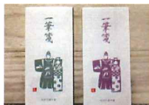
一筆箋 (制作: 前田集)

古民家Artの7つの会場をめぐるスタンプ ラリーです。各会場のスタンプを集めると、 「なはりの郷」にて記念品を1つプレゼント します(先着順)。歴史的な建物が残されて いる奈半利の町並みを歩いてみよう!