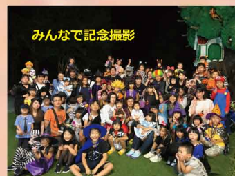
★コスプレさん大集合！ ～みんなで記念撮影～ 時間：18：00・19：00

★コスプレで来園の方、 先着 300名に缶バッジ進呈！ 時間：17：00～ 場所：入口ゲート前広場 ★フェイスペインティング 時間：17：30～18：30 場所：どうぶつ科学館 1F