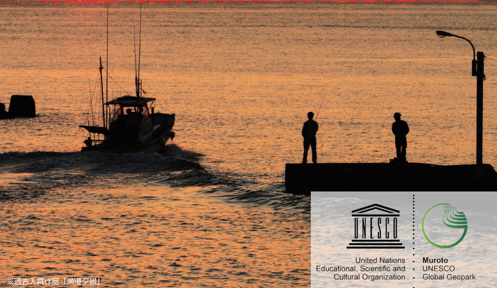
※過去入賞作品「漁港夕景」