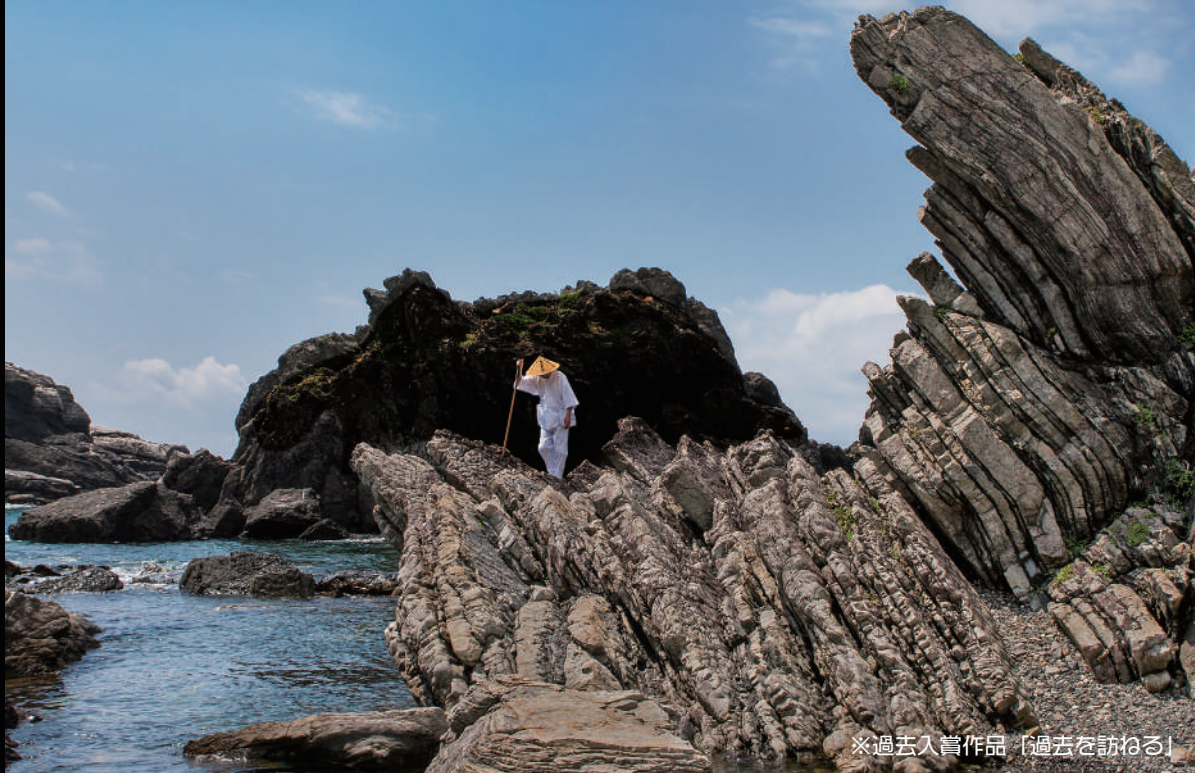
※過去入賞作品「過去を訪ねる」