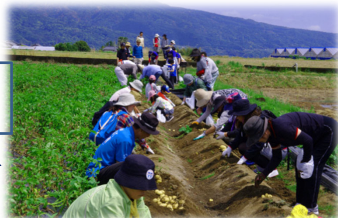
※掲載写真は全てイメージです。