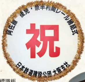
標識板 (阿佐線レール締結祝い)