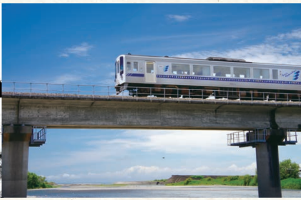
ごめん・なはり線電車