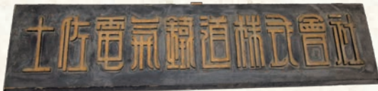
土佐電気鉄道株式会社 社名板