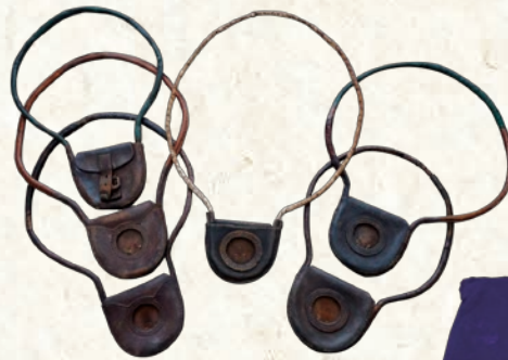
タブレットキャリア