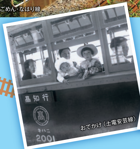
高知行 キハニ 2001