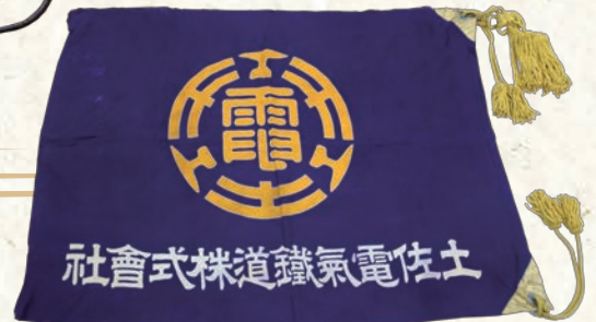
土佐電気鉄道株式会社 社旗