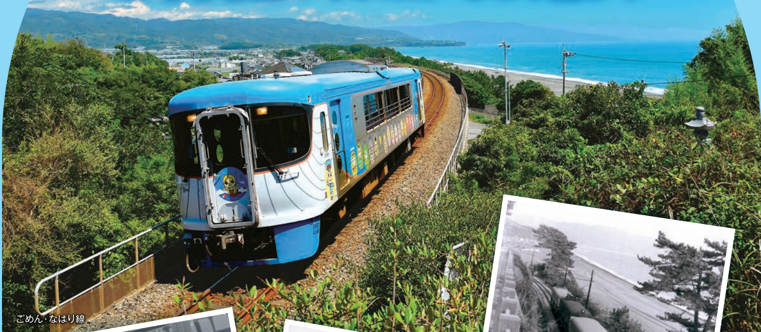
ごめん・なはり線