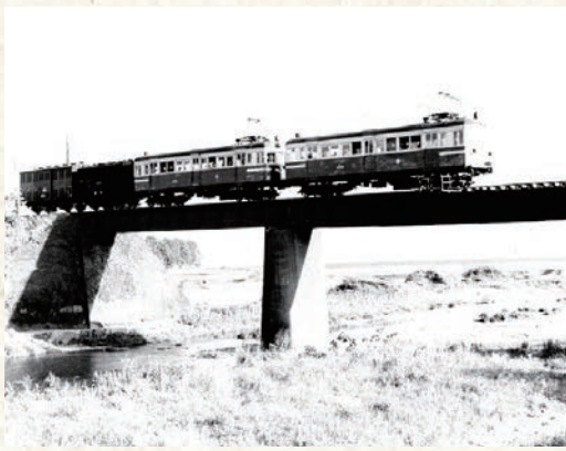
土電安芸線電車(赤野)