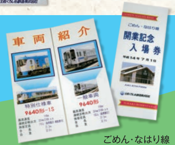
ごめん・なはり線 開業記念入場券