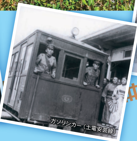
ガソリンカー(土電安芸線)