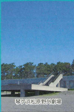
琴ヶ浜松原野外劇場